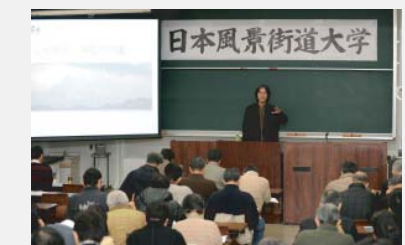
◀セミナー・勉強会の側面的支援