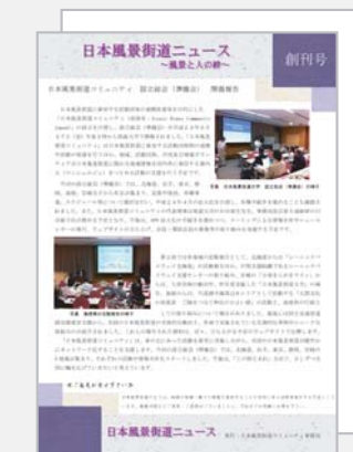
◀ニュースレター「日本風景街道ニュース」の発行

日本風景街道大学等、各地の日本風景街道で開催される各種会議・フォーラム・勉強会等へ参加するとともに、後援等の協力を行います。